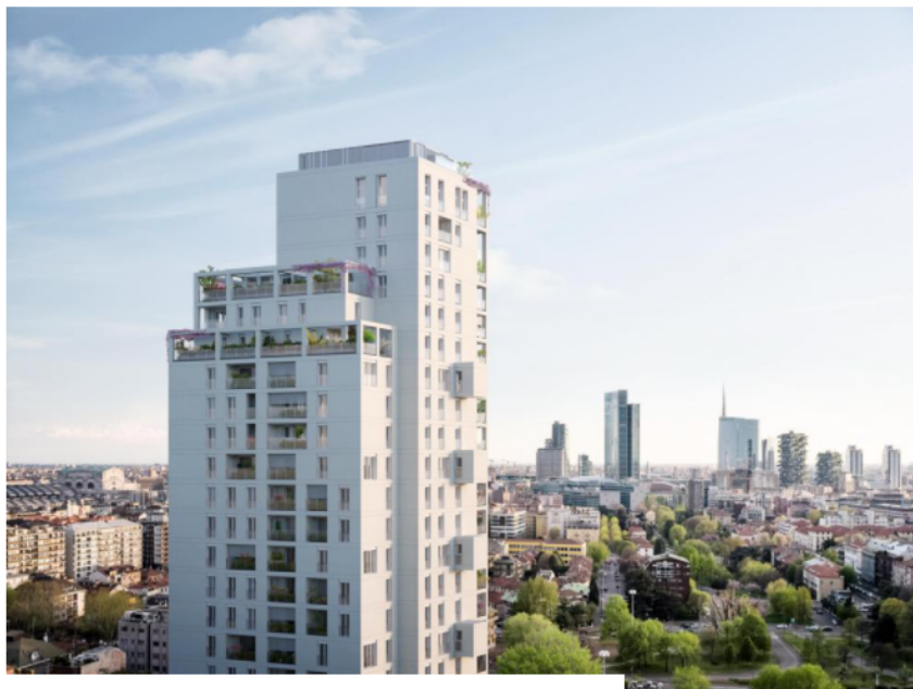
di Abrina Vellutini Il richiamo al razionalismo milanese sposa nell'edificio progettato da Studio Beretta Associati con una centralità di quartiere e appartamenti realizzati all'insegna di flessibilità e wellness privato