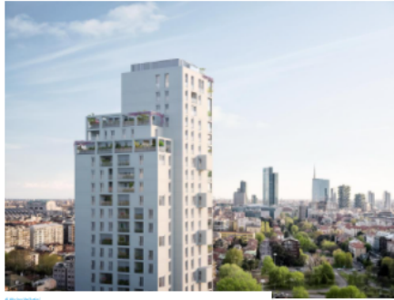
di Abrina Vellutini Il richiamo al razionalismo milanese sposa nell'edificio progettato da Studio Beretta Associati con una centralità di quartiere e appartamenti realizzati all'insegna di flessibilità e wellness privato